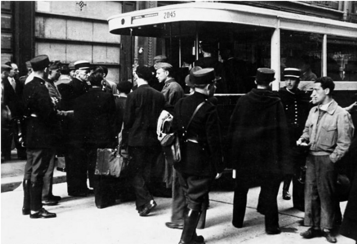
Облава на евреев в Париже, август 1941

По словам Земмура, 75% французских евреев, переживших войну, были «спасены стратегией лидера Виши маршала Петена и премьер-министра Лавалея перед лицом требований Германии». Ради этого, признает журналист, режим намеренно «пожертвовал иностранными евреями, жившими во Франции».