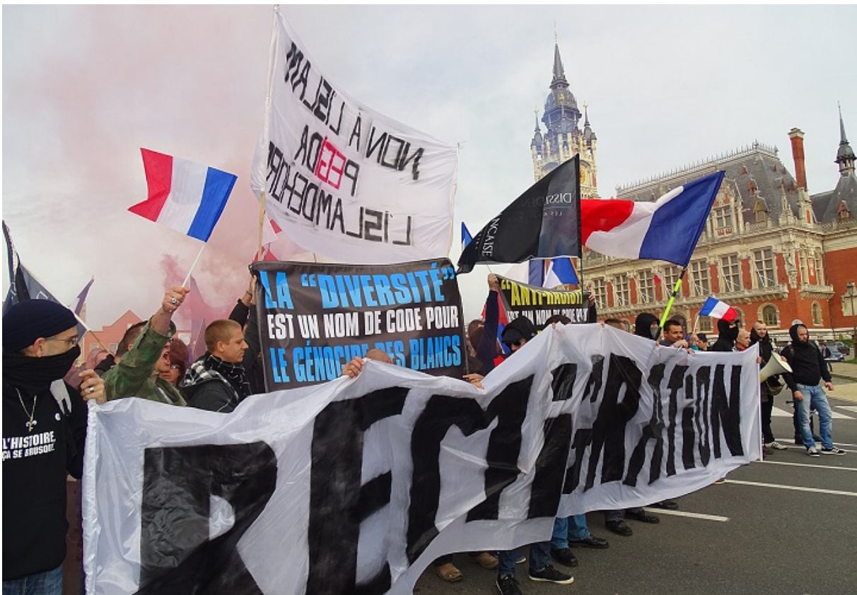
Митинг в Кале против иммиграции, 2015

1 октября 2020 года прокуратура открыла уголовное дело о подстрекательстве к ненависти после того как публицист назвал всех иммигрантов «ворами, убийцами и насильниками» и отметил, что «все они подлежат депортации». Сам он объявляет себя «не преступником, а диссидентом», выступающим за «величие Франции, силу государства и уважение к французской культурной традиции». Кроме антиисламской риторики журналист известен как сексист, евроскептик и критик либеральных ценностей.