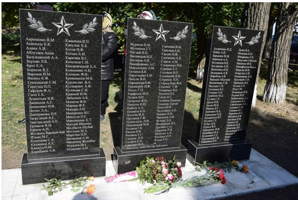
Стелы павшим воинам в селе Заповитное