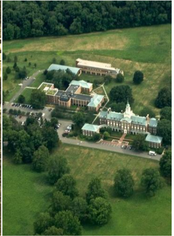
Институт перспективных исследований в Принстоне

В биографии этого выходца из традиционной еврейской семьи есть еще один эпизод, который можно трактовать двояко. В конце 1920-х крупный еврейский бизнесмен и филантроп Луис Бамбергер хотел открыть стоматологическую школу в Ньюарке, куда, в отличие от большинства подобных заведений, еврейских студентов принимали бы без ограничений. Абрахам Флекснер отговорил его от этой затеи, убедив потратить $5 млн на создание Института перспективных исследований в Принстоне.