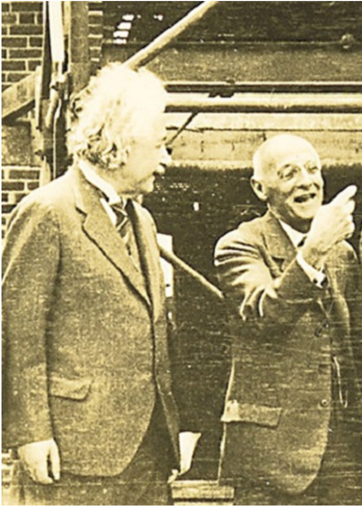
Альберт Эйнштейн с Флекснером, 1939