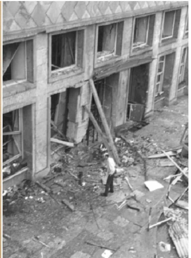
Взрыв, устроенный RAF в одном из клубов Франкфурта

Программа включала бег на выносливость, стрельбу по мишеням и рукопашный бой. «Хорст Малер был столь активен, — вспоминал один из соратников, — будто всегда хотел быть солдатом».