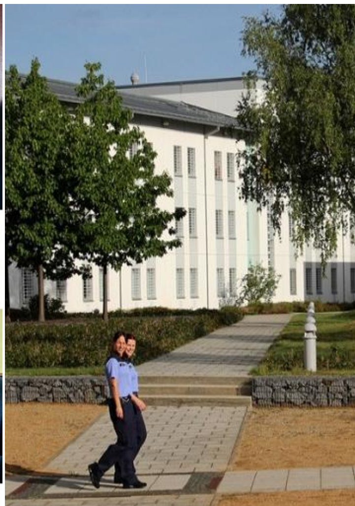
Тюрьма Котбус-Диссенхен.