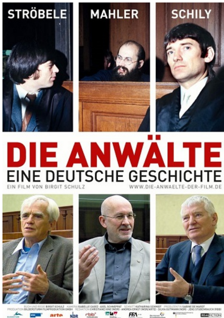
Постер фильма Die Anwalte с участием Малера, 2009