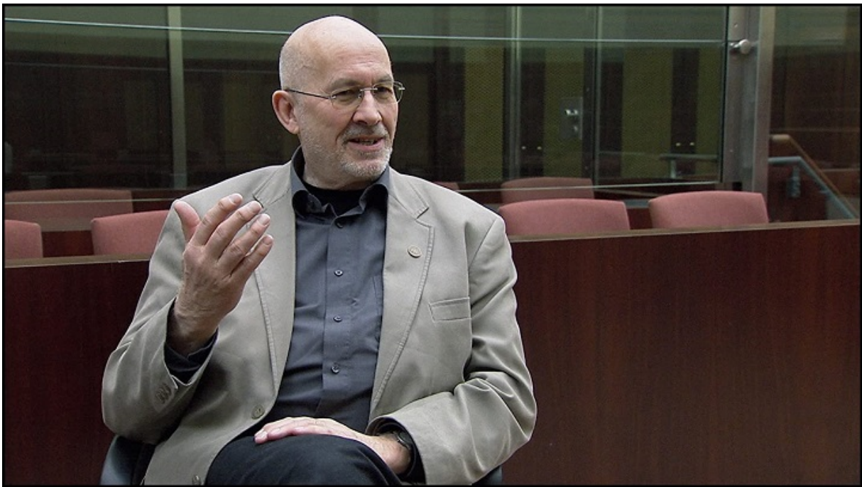
Хорст Малер.